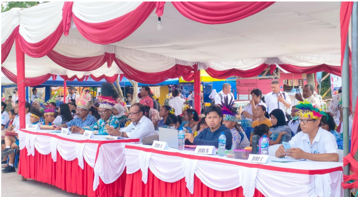
Gambar 1. Partisipasi dalam Kegiatan Sebagai Juri Lomba Pidato

Lomba Pidato Bahasa Inggris dan Bahasa Indonesia di Festival Biak Pintar telah mencapai hasil yang positif. Partisipasi yang tinggi dari peserta menunjukkan minat yang besar dalam mengembangkan kemampuan berbicara dan keterampilan berbahasa di Kabupaten Biak Numfor. Peserta lomba menunjukkan kualitas pidato yang baik dengan konten yang relevan, struktur yang terorganisir, dan kemahiran berbahasa yang memadai. Mereka juga mampu menyampaikan pidato dengan presentasi yang meyakinkan dan gaya berbicara yang baik.