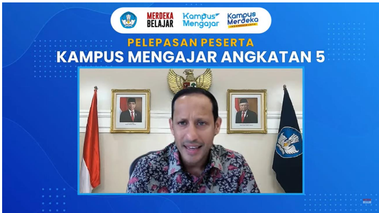
Gambar 3. Pelepasan Peserta Kampus Mengajar Angkatan 5 pada 17 Februari 2023