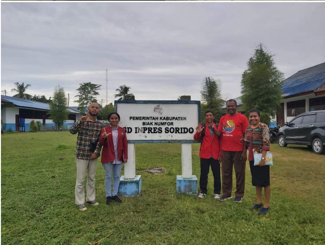
Gambar 3. Pendampingan Mahasiswa pada Dinas Pendidikan Kabupaten Biak Numfor dan SD Inpres Sorido Biak Kota