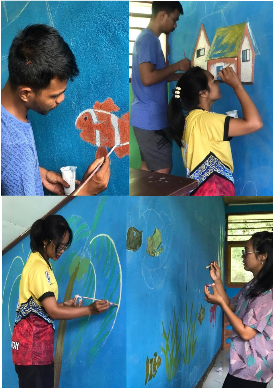
Gambar 12. Proses Pengecatan Tembok Di SD Negeri Marsram