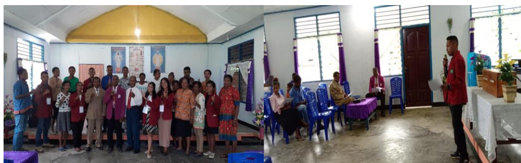
Gambar 7. Kegiatan Penyuluhan Hukum Perkawinan Yang Berlangsung Di GBI Firdaus Kampung Marsram