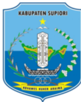
Gambar 2. Logo Pemerintah Kabupaten Supiori

Kabupaten Supiori merupakan hasil pemekaran dari Kabupaten Biak Numfor dan dibentuk berdasarkan Undang-Undang Nomor 35 tahun 2003. Kabupaten ini memiliki wilayah daratan seluas 704,24 Km 2 dan wilayah perairan seluas 5.993 Km 2 . Sebagian besar wilayah Kabupaten Supiori terletak di Pulau Supiori, sedangkan sebagian lainnya berada di Pulau Biak.