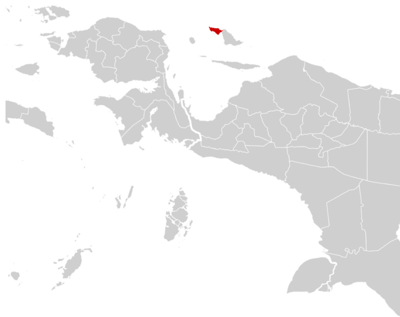
Gambar 1. Peta Lokasi Kabupaten Supiori Provinsi Papua

Kabupaten Supiori terletak di provinsi Papua, Indonesia, dengan pusat pemerintahannya berada di Sorendiweri. Pulau Supiori menjadi tempat berdirinya kabupaten ini dan terpisah dari Pulau Biak oleh Selat Sorendiweri. Dua pulau ini dihubungkan oleh sebuah jembatan sepanjang 100 meter yang melintasi Selat Sorendiweri. Kabupaten Supiori memiliki luas wilayah sebesar 678,00 km 2 , dan pada tahun 2020 penduduknya berjumlah 24.369 orang dengan kepadatan penduduk sebesar 35,94 jiwa/km 2 .