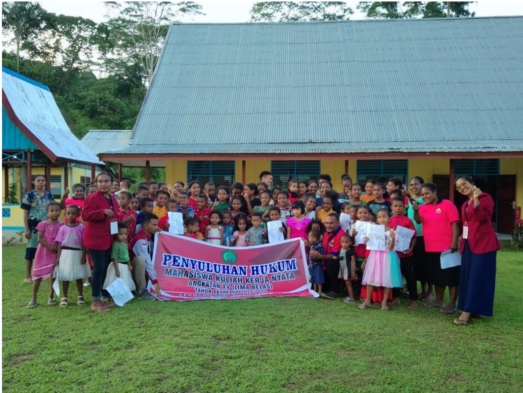
Gambar 9. Kegiatan Kampus Mengajar Di Sekolah Minggu Gereja Imanuel Marsram