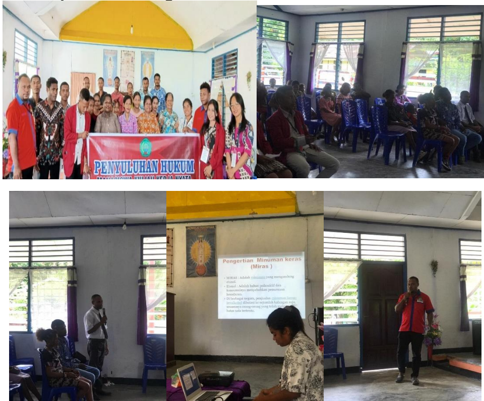
Gambar 11. Kegiatan Sosialisasi Bahaya Miras di Jemaat Gereja Gereja Firdaus Marsram