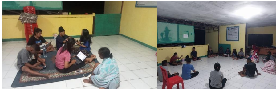
Gambar 6. Briefing Persiapan Kegiatan Penyuluhan Hukum Perkawinan Membahas Agenda Untuk Besok Hari Pelaksanaan