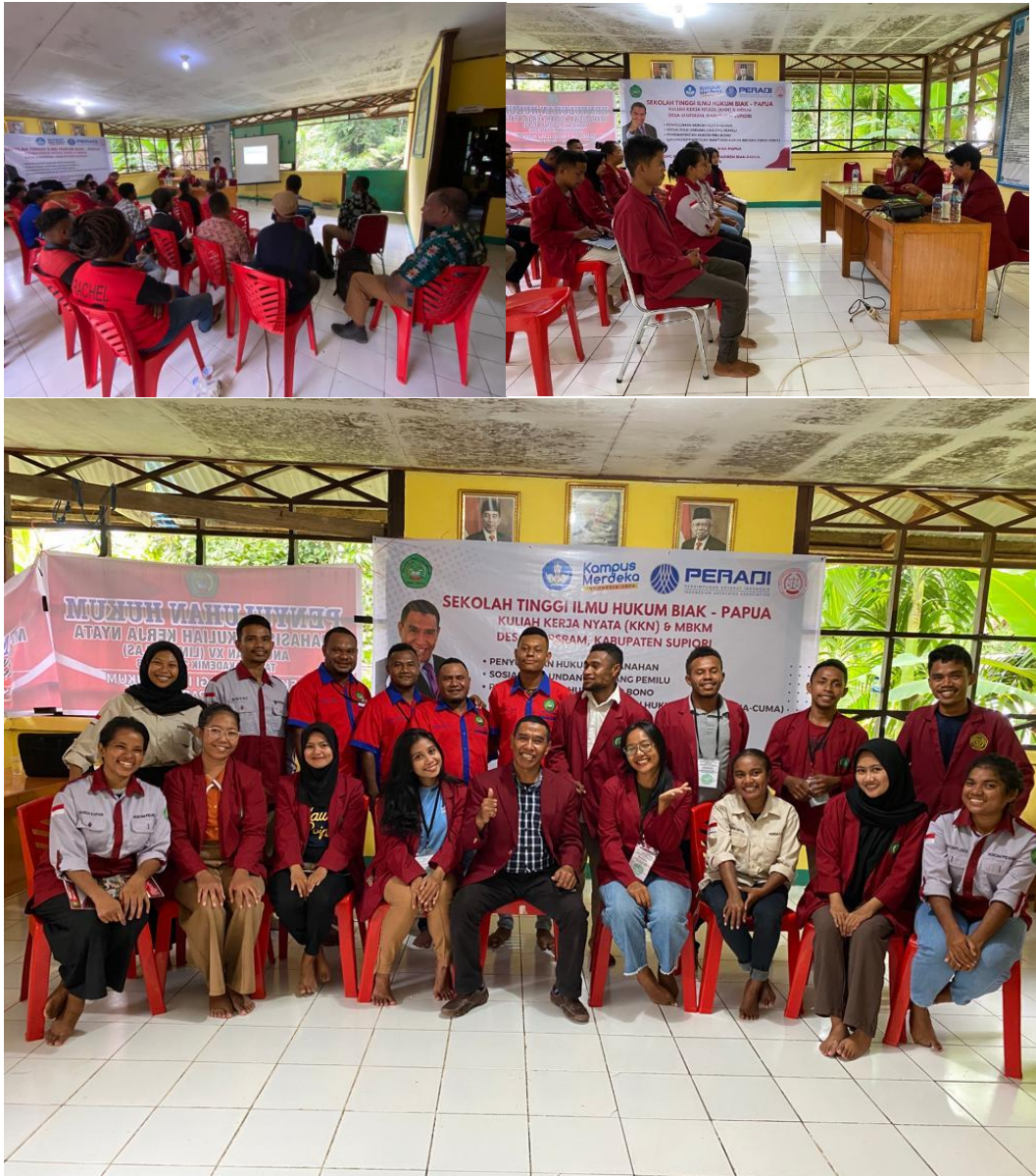
Gambar 13. Kegiatan Seminar Penyuluhan Hukum Pertanahan, Sosialisasi Undang-Undang Pemilu, dan Pendampingan Hukum Pro Bono di Kampung Marsram Supiori Papua