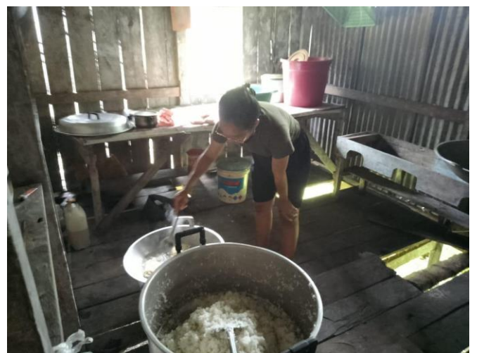
Gambar 5. Kegiatan kerja bakti dan Pembersihan area Lokasi KKN tanggal 14 Februari 2023