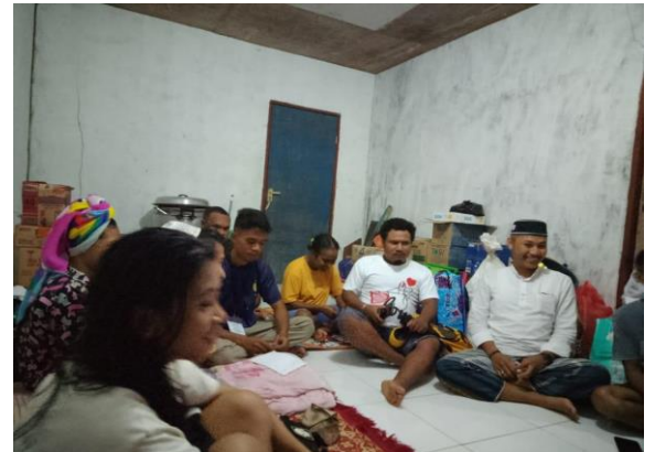
Gambar 4. Rapat koordinasi tanggal 13 februari 2023 untuk membahas kegiatan pembersihan lingkungan dan penentuan tempat tinggal bagi mahasiswa perempuan dan mahasiswa laki-laki