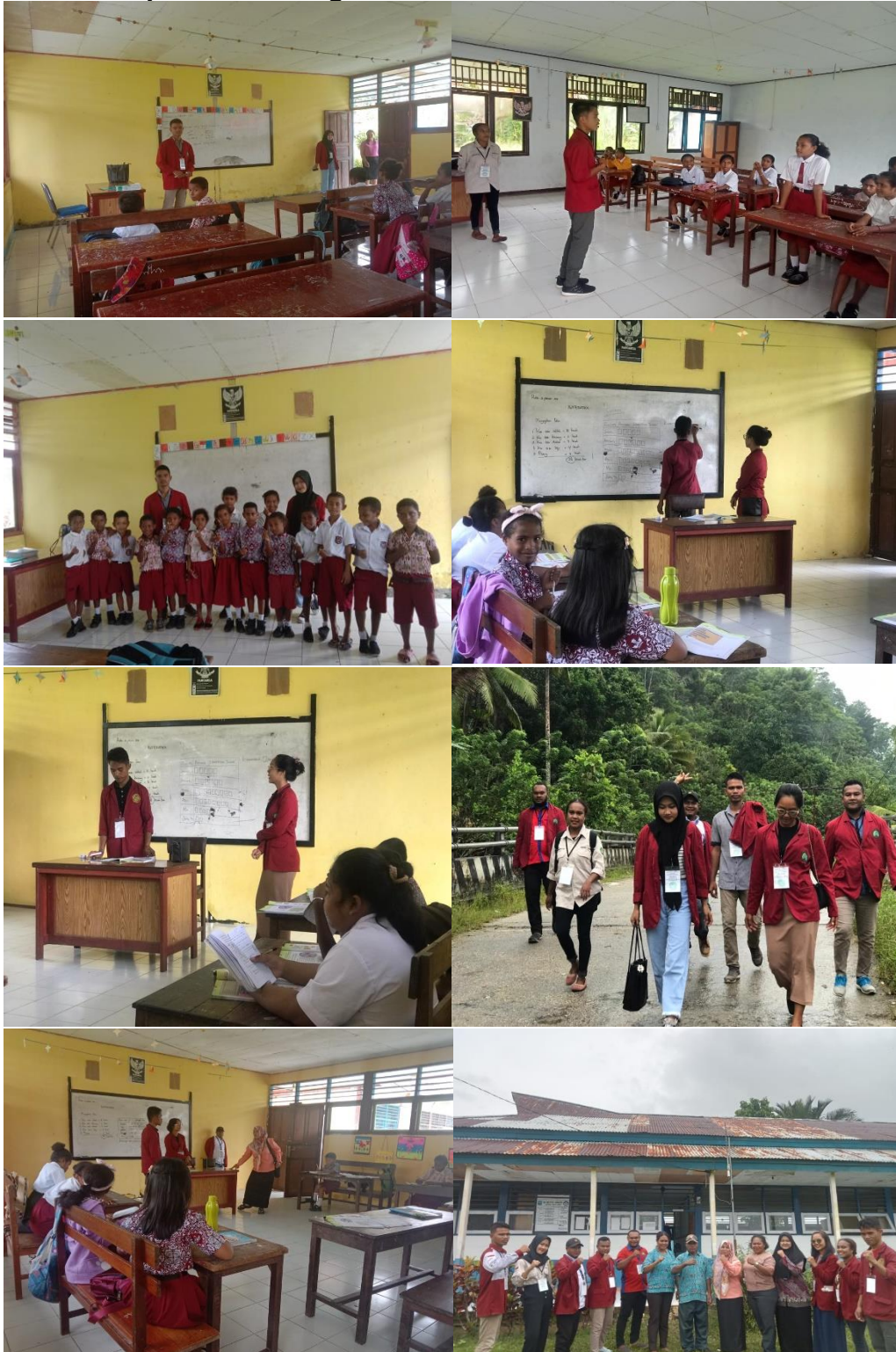
Gambar 8. Kegiatan Kuliah Kerja Nyata (KKN) Kampus Mengajar Di SD Wakre Supiori