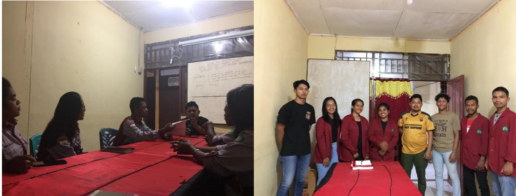
Gambar 14. Pelaksanaan Pra Penelitian di Polres Supiori