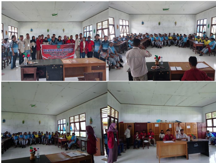
Gambar 10. Kegiatan Sosialisasi Bahaya Miras yang dilaksanakan di SMA Negeri 5 Wakre